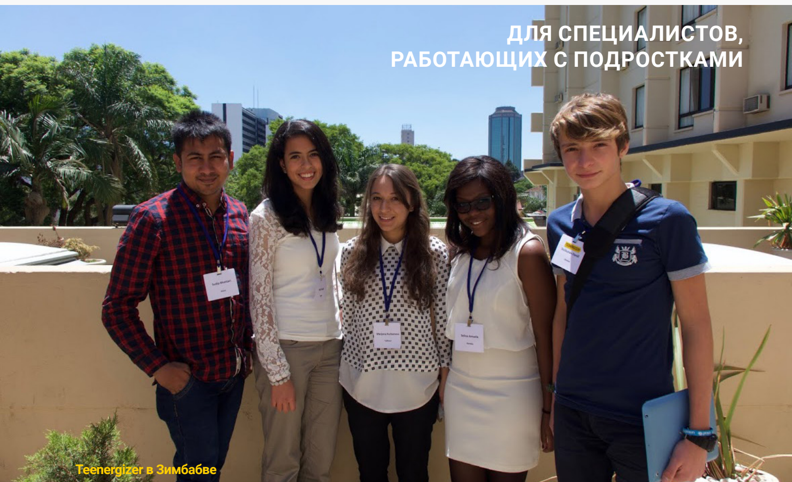
Teenergizer в Зимбабве

ДЛЯ СПЕЦИАЛИСТОВ, РАБОТАЮЩИХ С ПОДРОСТКАМИ