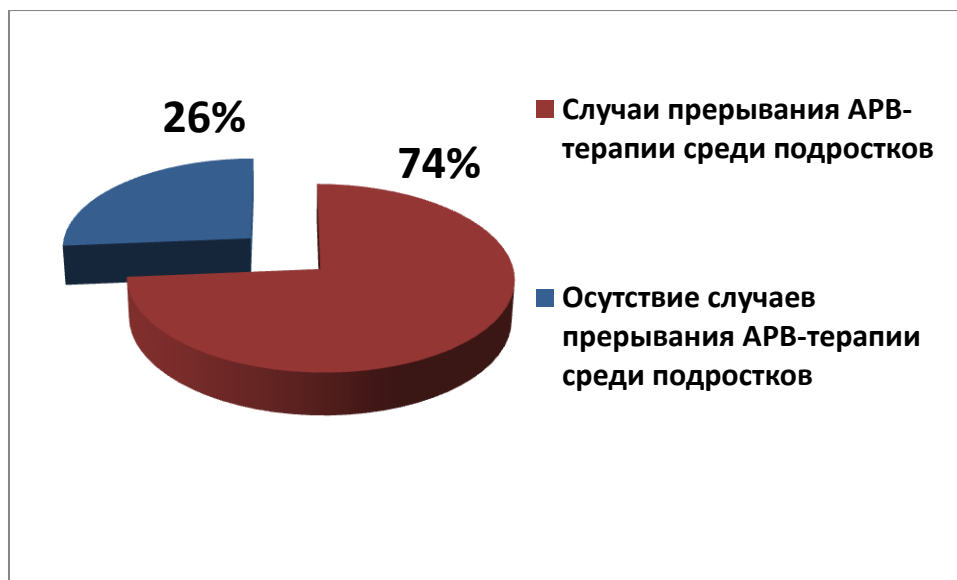
Рисунок 1. Случаи прерывания АРВ-терапии среди подростков в регионах

Во время визитов в регионы проводились встречи с медицинскими и социальными работниками областных/городских центров профилактики и борьбы с ВИЧ/СПИДом. В 14 из 19 регионов (74%) врачи-педиатры указали на то, что в своей работе они часто сталкиваются с прерыванием подростками приема АРВ-препаратов (Черниговская, Ивано-Франковская, Полтавская, Одесская, Донецкая и другие области).