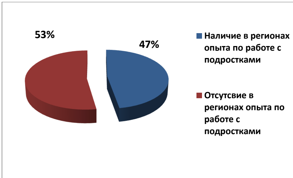
Рисунок 3. Наличие опыта в регионах по работе с ВИЧ-позитивными подростками

Результаты проведенного анализа свидетельствуют о том, что только в 9 из 19 регионов (38%) специалисты НПО имеют какой-либо опыт работы с ВИЧ-позитивными детьми и подростками. Это Полтавская, Киевская, Черновицкая, Донецкая, Одесская, Черкасская, Хмельницкая, Николаевская и Волынская области.